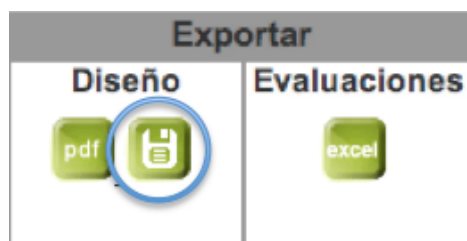
Figura 12.2 Ventana de exportación